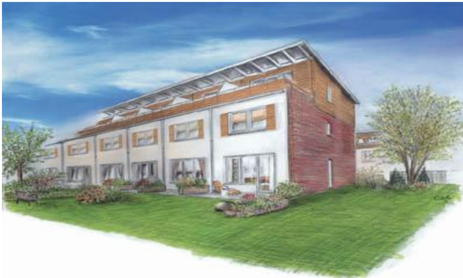
Neubau von 57 Reihenhäusern „An der Berner Au“