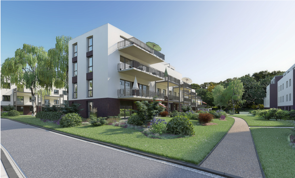
Präsentationsentwurf: Reekamp / Reeborn in Hamburg-Langenhorn