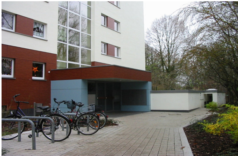
Modernisiert: Diekwisch 10 in Hamburg-Langenhorn