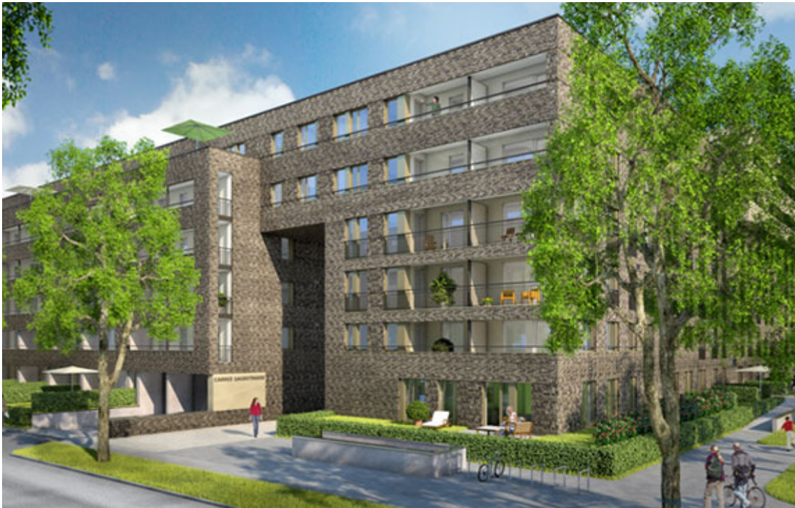
Neubau: Gaußstraße in 22765 Hamburg-Ottensen